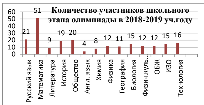
Рис.1. Диаграмма количество участников ВсОШ ШЭ в 2018-2019 уч.году

В школьном этапе олимпиад принимали участие учащиеся 4-11 классов – 90 обучающихся, из них победителей – 17 (19%), прослеживается снижение по сравнению с прошлым учебным годом на 1,5% и призеров -75 (83%), что свидетельствует о росте на 44% по сравнению с прошлым учебным годом. Значительное увеличение количества участников прослеживается по каждому учебному предмету.