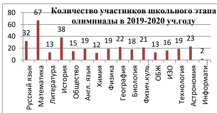
Рис.2. Диаграмма количество участников ВсОШ ШЭ в 2019-2020уч.году